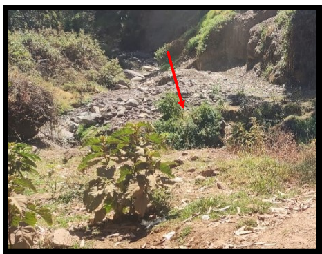
Imagen N°3: Sentido del río El Ingenio. colmatado de piedras, tierra y plantas.