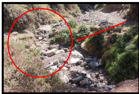
Imagen N°2: Maren izquierdo del río El Ingenio, colmatado de piedras y plantas.