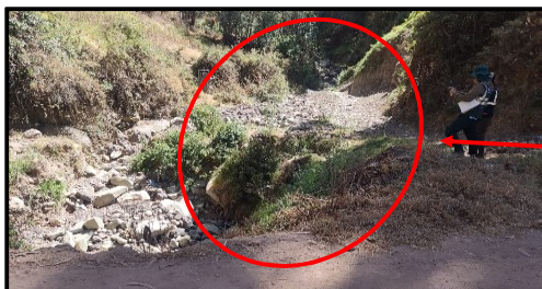
Imagen N°1: Maren derecho del río El Ingenio, colmatado de tierra, piedras y plantas.